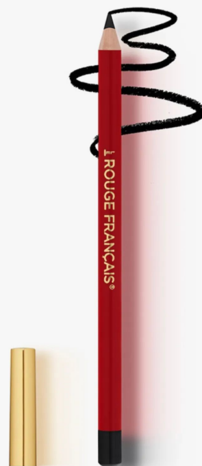
Le Rouge Français Le Noir Calistoga

Unlike the heavy lash extensions and strips that we’ve come to associate with American television stars, the Parisian faux lash is nearly imperceptible. For Sylvie’s portrayal of a powerful, “perfect elegant Parisian woman,” Payen’s application technique proves as much. “We wanted to elevate her natural beauty, so on the eyes, I would just apply a thin line of brown or black pencil and single eyelashes in different lengths,” she says. “Take singles one by one and mix the longest one with the tiniest one.” The result is an optical illusion that dramatically enhances the length and thickness of natural lashes. “When you see her, you can’t imagine that she has on fake eyelashes,” says Payen, who used Lash Lash’s range of believable individuals (and plenty of mascara) on set. And a bit of balm or a nude lip is enough to finish the effect since “with lashes, the mouth should be more quiet.”